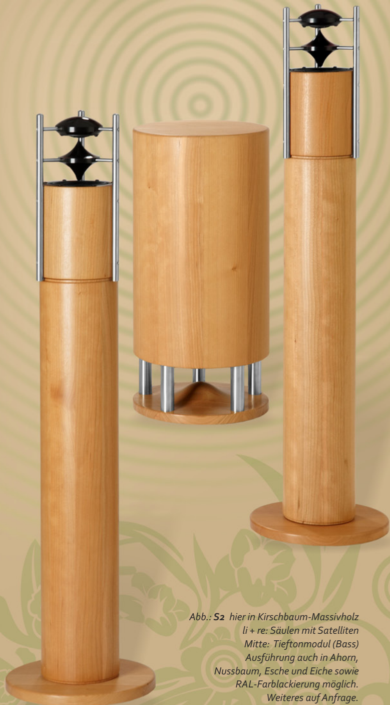
Abb.: S2 hier in Kirschbaum-Massivholz li + re: Säulen mit Satelliten Mitte: Tieftonmodul (Bass) Ausführung auch in Ahorn, Nussbaum, Esche und Eiche sowie RAL-Farblackierung möglich. Weiteres auf Anfrage.