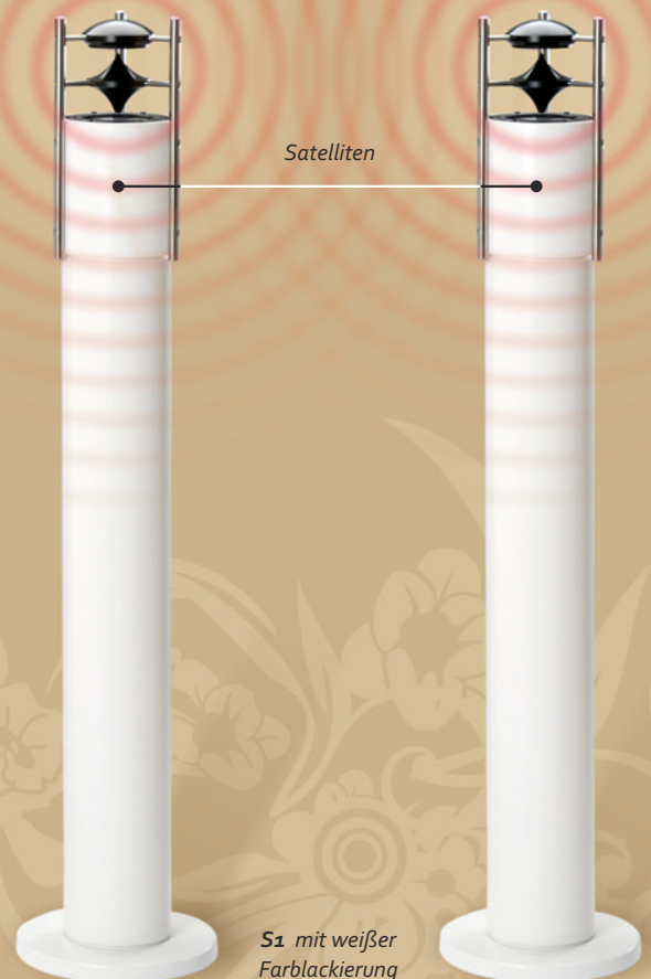
S1 mit weißer Farblackierung